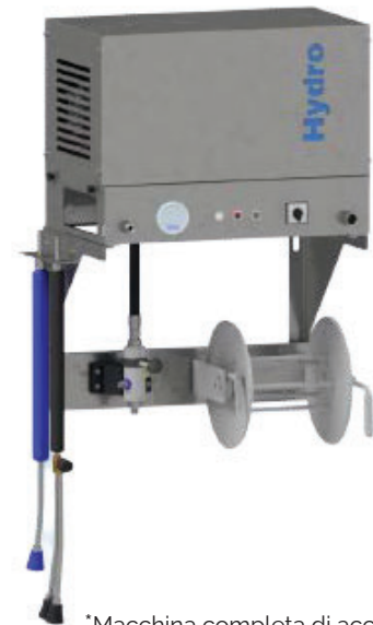
*Macchina completa di accessori